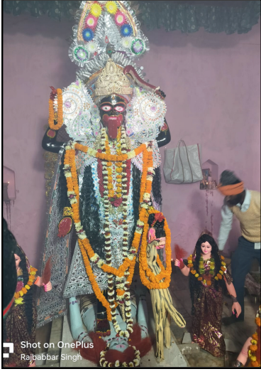
बता दें कि यहाँ प्रतिमा की प्राण प्रतिष्ठा के समय एक पाठा बलि देने की परंपरा है, वहीं शुक्रवार 9

बांका। बिहार। जिलांतर्गत रजौन प्रखंड तिलकपुर पंचायत अंतर्गत राजावर-नवादा सड़क मार्ग पर अवस्थित नीमा गांव में तीन दिवसीय माघी काली मेला गुरुवार 8 फरवरी की देर संध्या प्रतिमा की प्राण प्रतिष्ठा के साथ प्रारंभ हो गई है। वहीं गुरुवार की देर संध्या प्रतिमा की प्राण प्रतिष्ठा एवं पूजा- अर्चना के उपरांत श्रद्धालुओं के लिए पर खोल दिया गया है। मालूम हो वर्षों से यहां पर भगवान शंकर, गणेश, लक्ष्मी, सरस्वती सहित मां काली की आकर्षक प्रतिमा स्थापित कर पूजा- अर्चना की जाती रही है। वहीं इस वर्ष भी तीन दिन तक नीमा में माघी काली मेला 9 से लेकर 11 फरवरी तक लगने जा रहा है। प्राप्त जानकारी के अनुसार 12 फरवरी दिन सोमवार की अहले सुबह प्रतिमा को विसर्जित कर दिया जाएगा।