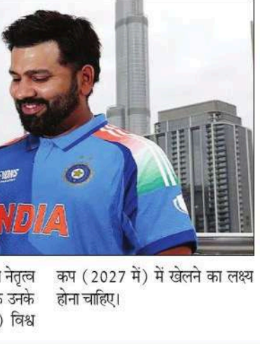
खेलना पसंद है। मुझे इस टीम का नेतृत्व करना पसंद है। मुझे लगता है कि उनके दिमाग में अगले (50-ओवर) विश्व कप (2027 में) में खेलने का लक्ष्य होना चाहिए।

सीरीज में एक शतक सहित 400 रन बनाए थे। बौते दिनों रिकी पोपिंग ने भी रोहित के करियर पर बात की थी। उन्होंने कहा था कि जब आप अपने करियर के उस मुकाम पर पहुंचते लगते हैं, तो हर कोई आपके रियर होने का इंतजार कर रहा होता है। और मुझे नहीं पता कि क्यों, जब आप अभी भी उतना ही अच्छा खेल सकते हैं जितना उन्होंने (चौपियंस ट्रॉफी फाइनल में) खेला है, तो मुझे लगता है कि वह बस उन सवालकों का हवाशा के लिए खरब करने की कोशिश कर रहे थे। और कह रहे थे कि मैं अभी भी काफी अच्छा खेल रहा हूँ। मुझे इस टीम में