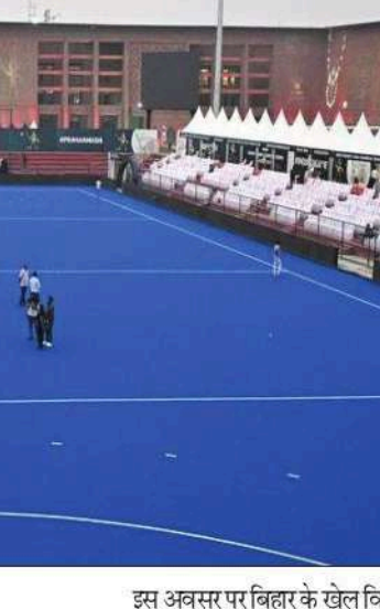
हस्ताक्षर किए। इस अवसर पर बिहार के खेल विभाग के

नई दिल्ली (एजेंसी)। बिहार के ऐतिहासिक शहर राजगीर में होने वाले पुरुष एशिया कप 2025 के लिए हॉकी इंडिया और बिहार राज्य खेल प्राधिकरण ने सोमवार को एक समझौता पत्र पर हस्ताक्षर किए। राजगीर के हॉकी स्टेडियम में 29 अगस्त से 7 सितंबर तक होने वाला यह टूर्नामेंट बेल्जियम और नीदरलैंड में 2026 में आयोजित होने वाले एफआईएच पुरुष हॉकी विश्व कप के लिए क्वालीफाइंग प्रतियोगिता है। इस महाद्वीपीय टूर्नामेंट के 12वें संस्करण में भारत, पाकिस्तान, जापान, कोरिया, चीन और मलेशिया सहित आठ टीमों हिस्सा लेंगी और शेष दो टीमों क्वालीफाइंग टूर्नामेंट एएनएफएफ कप के जरिए अपना स्थान सुरक्षित करने का प्रयास करेंगी। इस टूर्नामेंट को लेकर हॉकी इंडिया ने आज बिहार राज्य खेल प्राधिकरण के साथ एक समझौता पत्र पर