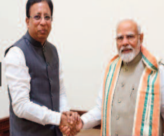
डॉ संजय जायसवाल, सांसद को हार्दिक बधाई