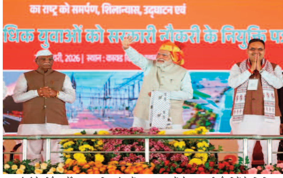
पर कार्यवाही हो रही है। उन्होंने बताया कि कार्यक्रम में 21,800 युवाओं को सरकारी नौकरियों के नियुक्ति पत्र

अजमेर, (एजेंसी)। पीएम नरेंद्र मोदी ने शनिवार को अजमेर के कायड़ विश्रामस्थली में आयोजित जनसभा में कांग्रेस पर तीखा हमला बोला। उन्होंने कहा कि कांग्रेस के कुकर्मों को देश कभी माफ नहीं करेगा। उन्होंने आरोप लगाया कि कांग्रेस देश और सेना को बदनाम करने की पुरानी आदत से बाज नहीं आ रही है। पीएम मोदी ने कहा कि कांग्रेस अब अपने मूल स्वरूप में नहीं रही। पहले यह यानी इंडियन नेशनल कांग्रेस थी, अब यह एमएमसी यानी मुस्लिम लीगी माओवादी कांग्रेस बन गई है। उन्होंने आरोप लगाया कि लगातार चुनावी हार से निराश कांग्रेस विदेशी मंत्रियों पर भी भारत की छवि खराब करने की कोशिश कर रही है। मीडिया रिपोर्ट के मुताबिक पीएम मोदी ने हाल ही में दिल्ली में आयोजित