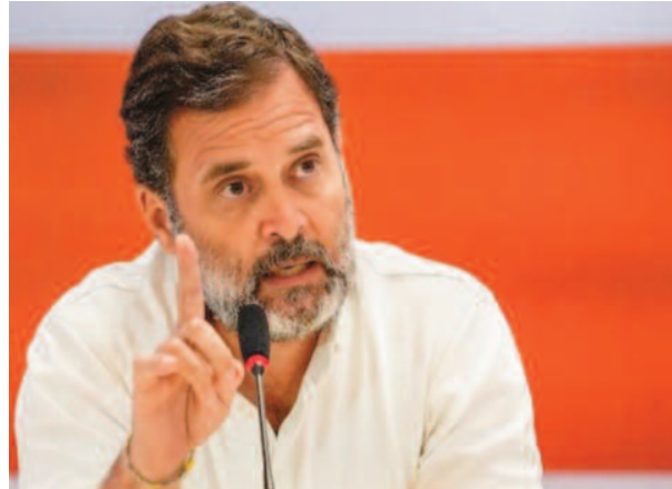
दिव्यांगता पेंशन का मकसद उन सैनिकों को राहत देना है, जिन्हें चोटें

फीसदी कम है और पेमेंट न होने की वजह से अस्पताल इससे बाहर हो रहे हैं। पूर्व सैनिकों को अपनी जेब से पैसे देने पड़ रहे हैं या कैसर जैसी गंभीर बीमारियों के इलाज में भी देरी हो रही है। जिन्होंने देश की सेवा की, वे जरूरत के समय में खुद को उपेक्षित महसूस कर रहे हैं। राहुल ने पत्र में लिखा- वित्त विधेयक 2026 में सैनिक के सर्विस में बने रहने पर दिव्यांगता पेंशन पर टैक्स लगाने का प्रस्ताव है। 1922 के बाद यह पहली बार है, जब दिव्यांगता पेंशन पर टैक्स लगाया जा रहा है।