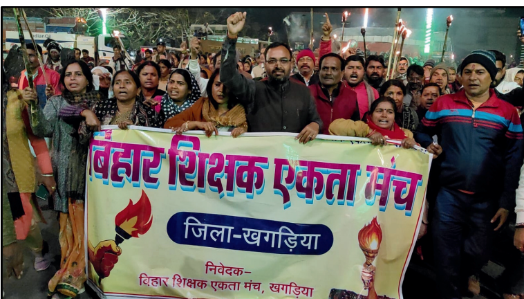
रेशु रंजन, दैनिक बिहार पत्रिका

खगड़िया। बिहार शिक्षक एकता मंच के आह्वान पर शहर में शिक्षकों ने शनिवार की शाम मशाल जुलूस निकालकर विरोध जताया। इस दौरान शिक्षकों ने सरकार विरोधी नारे लगाए तथा दमनात्मक कार्रवाई के खिलाफ गोलबंद हुए एवं सक्षमता परीक्षा बहिष्कार का संकल्प लिया। शिक्षक नेताओं ने अध्यक्ष मंडल और सचिव मंडल ने संयुक्त रूप से बताया कि सूबे के तमाम नियोजित शिक्षक दक्षता एवं पात्रता परीक्षा उत्तीर्ण है तो फिर यह कैसी परीक्षा। क्या शिक्षक जीवन भर परीक्षा ही देते रहेंगे। अध्यक्ष मंडल ने बताया कि बिना शर्त राज्यकर्मी का दर्जा की प्राप्ति तक हमारा संघर्ष न्यायालय से लेकर सड़क एवं सदन तक जारी रहेगा। शिक्षकों से आह्वान करते हुए कहा कि पूरी एकजुटता के साथ 13 फरवरी को विधानसभा के समक्ष विराट प्रदर्शन में मजबूती