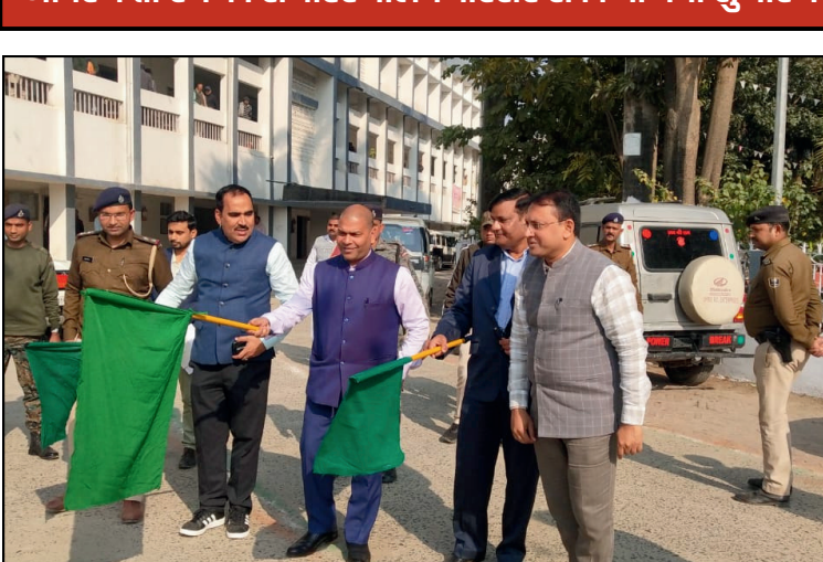
दैनिक बिहार पत्रिका, खगड़िया

जागरुकता रथ का समाहरणालय परिसर से किया गया शुभारंभ