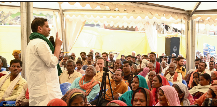
दैनिक बिहार पत्रिका, खगड़िया

जन् सुराज के सूत्रधार प्रशांत किशोर के जीडीपी वाले बयान पर तंज कसा है। वहीं कहा कि जो स्कूल नहीं गया, फेल हुआ, पिछली बेंच पर बैठा वहीं यहां का नेता है। वहीं बता रहा है कि यहां विकास हो रहा है। उसे विकास लिखने नहीं आता है कि इस शब्द को लिखने में बड़ी ई की मात्रा का प्रयोग होता है या छोटी इ का। अभी आपने कुछ दिन पहले देखा होगा कि यहां के नेता तेजस्वी यादव ने कहा था कि GDP तो सबसे ज्यादा बिहार की है, उनको ये समझ ही नहीं है कि