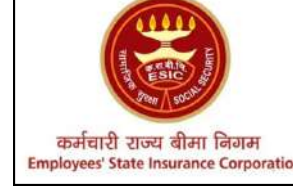
कर्मचारी राज्य बीमा निगम Employees State Insurance Corporation

कर्मचारी राज्य बीमा निगम (ईएसआईसी) योजना अब देश के कुल 788 जिलों में से 687 जिलों में लागू हो चुकी है। वर्ष 2014 में यह 393 जिलों में ही लागू थी लेकिन पिछले 10 वर्षों में इस प्रक्रिया में उल्लेखनीय वृद्धि हुई है। प्रधानमंत्री जन आरोग्य योजना के साथ सहयोग करके ईएसआईसी योजना को अब शेष 101 जिलों में भी विस्तारित किया जाएगा। एक सरकारी प्रवक्ता ने बताया कि श्रम एवं रोजगार मंत्री डॉ. मनसुख मांडविया के